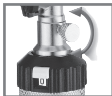
KaWe EUROLIGHT® C30, F.O.30 KaWe COMBILIGHT® F.O.30