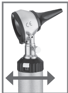
KaWe EUROLIGHT® C10 KaWe COMBILIGHT® C10